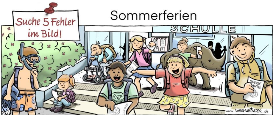
Taucher, alter Mann, Nashorn, Schulle, Speisekarte

Jeweils im Ev. Gemeindehaus Biblis, Darmstädter Str. 76