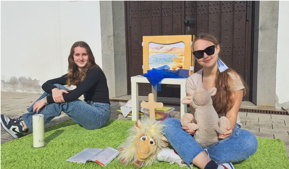
Bild: Kinderkirche im Frühjahr 24 vor der Kirche

Aufgrund der Dachdeckerarbeiten und dem Wetter fand unsere Kinderkirche mit lustigem Sommerfest im Gemeindehaus statt.